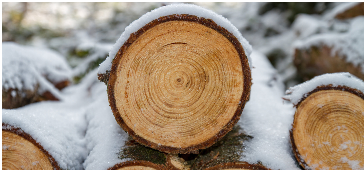
Das Holz mit seinen Lebensringen als Sinnbild für unser Wachsen und Vergehen