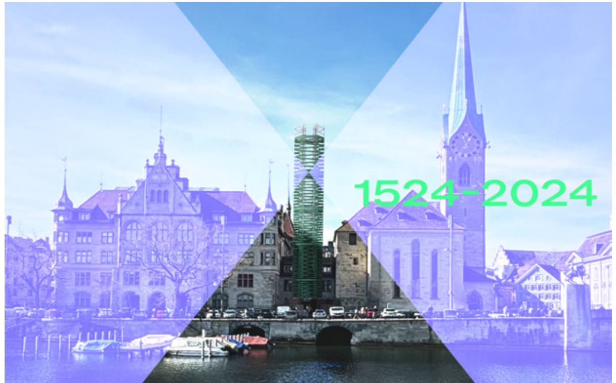
Die Installation Katharinenturm beim Fraumünster in Zürich

Sonntag, 1. Dezember, 11.15 Uhr, Saal Chilegass